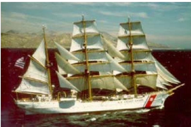
Abb. 33: Das Segelschulschiff „Eagle“, ein Schwesterschiff der Gorch Fock , 1936 bei Blohm & Voss in Hamburg gebaut, wurde 1946 von den Amerikanern als Reparation konfisziert dient es auch heute noch der amerikanischen Coast Guard. Das Herumsegeln mit konfisziertem Eigentum ist typisch für die USA.

Um die wirtschaftliche und finanzielle Situation Deutschlands heute zu verstehen, muss man zur Situation Deutschlands am Ende des Zweiten Weltkrieges zurückkehren. Die USA sahen Deutschland damals als einen Konkurrenten auf dem Weltmarkt , auf den man aufpassen muss, damit er nicht technologisch überholt oder zu viele Ressourcen verbraucht. Deutschland interessierte die USA in erster Linie als Militärstützpunkt, als Geldlieferant , als Risikoversicherer und als Workshop für bestimmte Produkte.